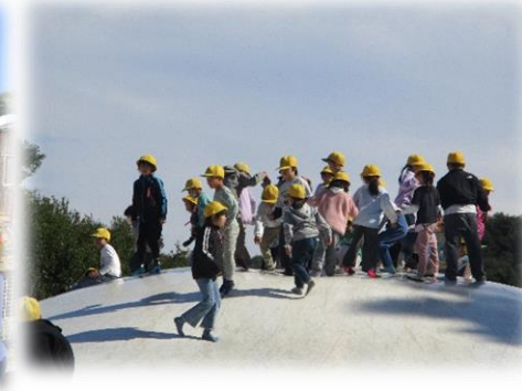
【にじゅうまるお話の会】 ～温かいお話をいただきました～