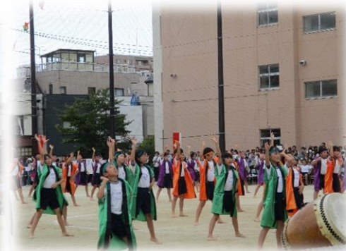
【2年 校外学習】 ～森林公園～