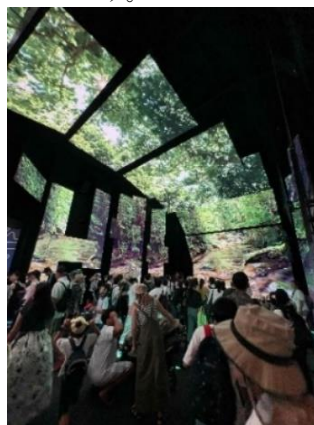
オーストラリア館

1970年の万博が「人類の進歩と調和」をテーマに技術文明の進歩をアピールしていましたが、2025年の万博では「いのち」をテーマに、技術と人間性や社会課題の調和、持続可能な社会のあり方を問い直すことをアピールしてました。そして、会場の雰囲気からは国際化社会、様々な価値観があふれる社会など、多様な人々との共生社会であることも実感しました。科学技術の進歩は日進月歩でたゆみなく成長し続けています。そして、多文化共生のみならずヒトを含む地球上の全ての動植物、自然環境とも協調して科学技術を進展させることが大切です。