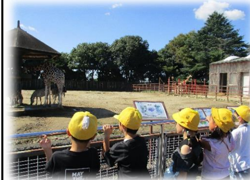
【就学時健診】 ～5年生が案内しました～