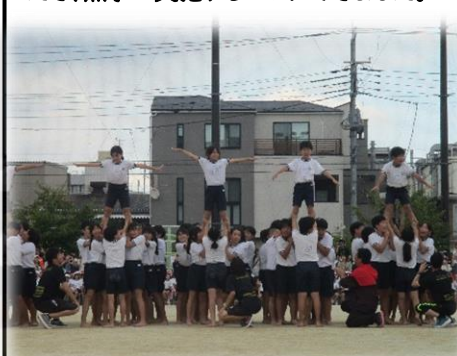
【1年 校外学習】 ～東武動物公園～

天候の関係で1日延期いたしました。保護者の皆様、地域の皆様のご理解・ご協力をいただき、無事に実施することができました。